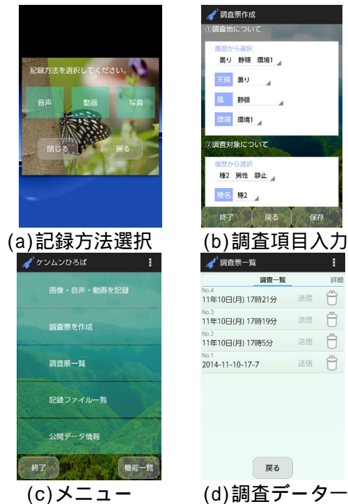
図2 モニタリングデータ収集アプリケーション